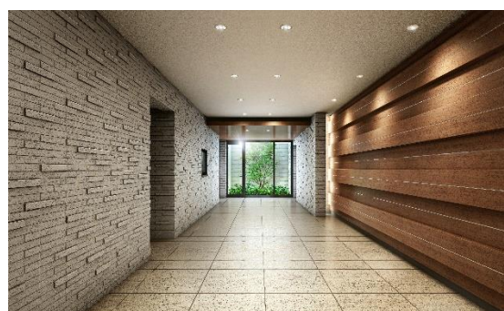
< エントランス >