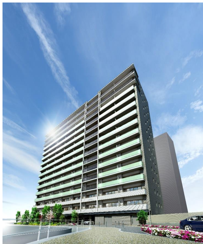
< 外観 >