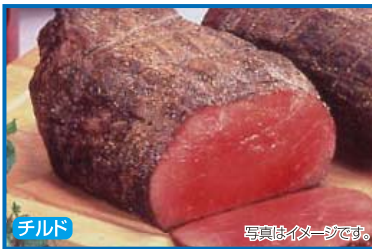
チルド 写真はイメージです。

商品記号 8-A 埼玉県産幸水梨 ●2.5kg(計8～10個) ●原産地:埼玉県